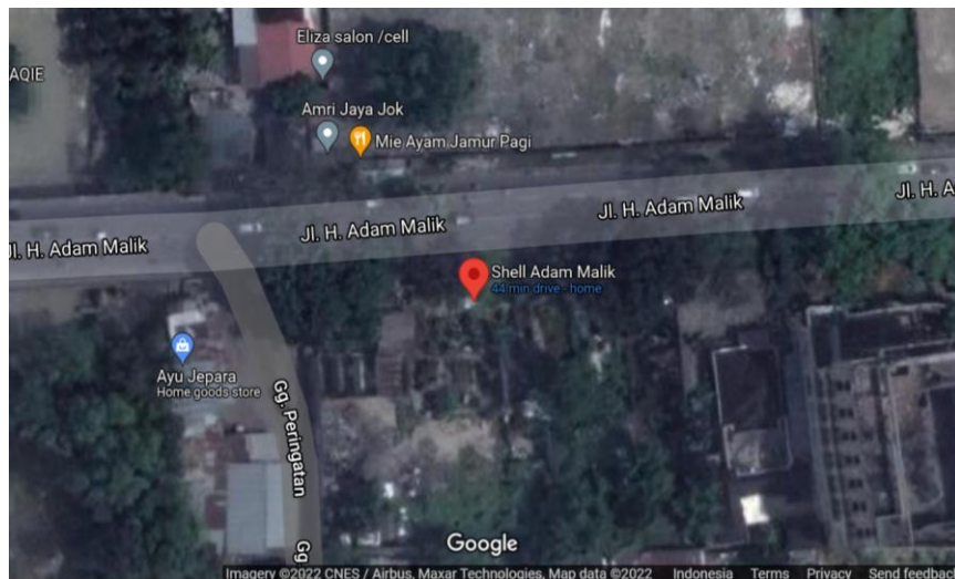
Gambar 1. Peta Lokasi Proyek

Lokasi proyek pembangunan kantor SPBU Shell Adam Malik-1 ini terletak di Jalan H. Adam Malik, Sililas, Kec. Medan Barat, Kota Medan, Sumatera Utara (Gambar 1).