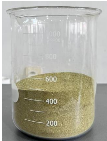
Gambar 3: Serbuk daun eceng gondok

Biooil merupakan produk cair hasil kondensasi uap pirolisis eceng gondok yang terbentuk selama proses pemanasan tanpa oksigen. Biooil yang dihasilkan dikumpulkan dan disimpan dalam wadah tertutup untuk mencegah penguapan serta kontaminasi dari lingkungan yang dapat dilihat pada Gambar 4. Secara umum, biooil yang diperoleh menunjukkan karakteristik khas produk pirolisis biomassa. Selanjutnya, biooil dianalisis untuk menilai kualitas produk yang dihasilkan, meliputi pengujian densitas, viskositas, flash point , pour point , stabilitas oksidasi, bilangan asam, bilangan iodine , serta kandungan senyawa kimia bio-oil tersebut, sebagai dasar evaluasi potensi pemanfaatannya sebagai bahan bakar cair alternatif.