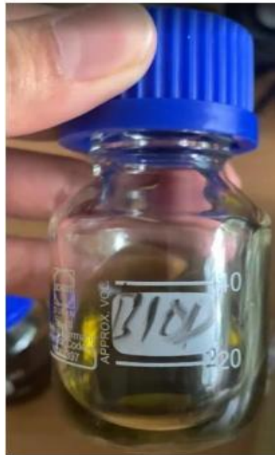
Gambar 4: Biooil hasil pirolisis dari daun eceng gondok

Biooil merupakan produk cair hasil kondensasi uap pirolisis eceng gondok yang terbentuk selama proses pemanasan tanpa oksigen. Biooil yang dihasilkan dikumpulkan dan disimpan dalam wadah tertutup untuk mencegah penguapan serta kontaminasi dari lingkungan yang dapat dilihat pada Gambar 4. Secara umum, biooil yang diperoleh menunjukkan karakteristik khas produk pirolisis biomassa. Selanjutnya, biooil dianalisis untuk menilai kualitas produk yang dihasilkan, meliputi pengujian densitas, viskositas, flash point , pour point , stabilitas oksidasi, bilangan asam, bilangan iodine , serta kandungan senyawa kimia bio-oil tersebut, sebagai dasar evaluasi potensi pemanfaatannya sebagai bahan bakar cair alternatif.