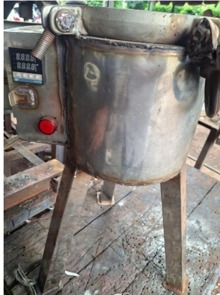
Gambar 1: Alat yang digunakan dalam proses pirolisis

Tahap selanjutnya adalah proses pirolisis, dimana eceng gondok yang telah dihaluskan dimasukkan ke dalam reaktor pirolisis. Proses pirolisis dilakukan dengan pemanasan pada temperatur tinggi tanpa oksigen, pada rentang temperatur sekitar 550°C selama 1 jam. Uap hasil pirolisis didinginkan menggunakan kondensor untuk mengumpulkan biooil sebagai produk utama. Tahapan terakhir adalah proses pengumpulan dan pemisahan produk. Produk hasil pirolisis terdiri dari biooil (cair), arang ( char ), dan gas. Biooil ditampung dalam wadah penampung setelah kondensasi dan arang diambil setelah reaktor mendingin dan dipisahkan dari residu padat. Pada tahap pirolisis menggunakan alat pirolisis yang dapat dilihat pada gambar 1.