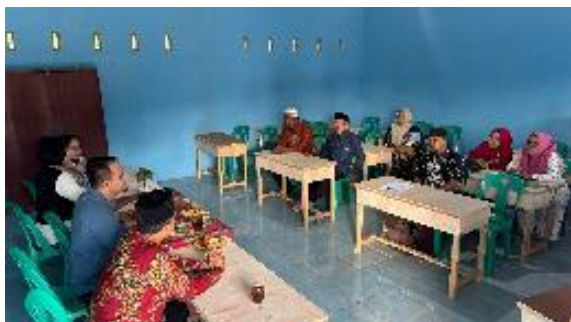
Gambar 3. Penyuluhan dan diskusi dengan para pengurus sekolah

Kegiatan ini tidak hanya berhenti pada proses penyuluhan, tim pengabdian akan secara berkala berkomunikasi dengan pihak sekolah untuk mengetahui perkembangan sekolahnya. Jika diperlukan akan dilakukan kegiatan-kegiatan pengabdian lainnya untuk membantu sekolah-sekolah yang memiliki keterbatasan seperti ini.