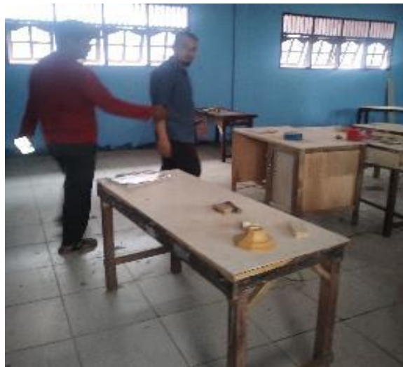
Gambar 2. Pelatihan rekondisi sarana meja belajar kepada tukang

Gambar proses dan hasil penjelasan kepada tukang kayu dapat dilihat pada gambar 2 berikut ini.