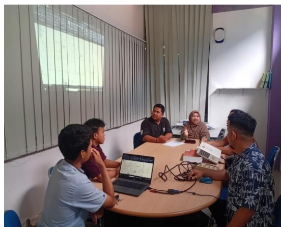
Gambar 3. Sesi pelatihan AutoCAD bersama mitra PT. Sadli Jaya Abadi yang difasilitasi oleh tim pengabdian

kepuasan dan efektivitas kegiatan. Evaluasi juga mencakup observasi hasil implementasi desain digital dan pencatatan keuangan pada operasional mitra.