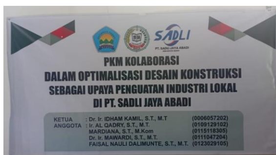
Gambar 1. Spanduk kegiatan PMKM kolaborasi di PT. Sadli Jaya Abadi sebagai bentuk penguatan sinergi antara perguruan tinggi dan dunia industri lokal

Dalam konteks ini, kehadiran program PMKM menjadi penting karena dapat menjadi jembatan bagi transfer teknologi dan pengetahuan dari perguruan tinggi kepada industri lokal. Perguruan tinggi sebagai pusat ilmu pengetahuan dan inovasi memiliki potensi besar untuk mendorong peningkatan kualitas SDM dan efisiensi proses produksi di kalangan pelaku UMKM. Oleh karena itu, kegiatan ini dilatarbelakangi oleh kebutuhan untuk membangun sinergi antara institusi pendidikan tinggi dan dunia usaha dalam menciptakan solusi nyata terhadap persoalan yang dihadapi di lapangan.