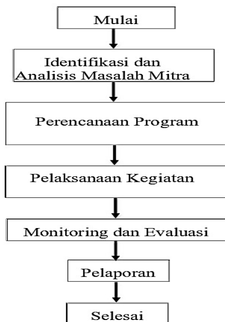
Gambar 2. Diagram alir

Tahap kedua adalah perencanaan program pelatihan dan pendampingan, yang melibatkan penyusunan materi pelatihan AutoCAD tingkat dasar hingga menengah, pengelolaan usaha mikro, strategi branding dan pemasaran digital, serta legalitas dan pengembangan kelembagaan. Materi disesuaikan dengan kebutuhan nyata mitra di lapangan agar implementasi pelatihan dapat langsung diterapkan dalam aktivitas bisnis harian.