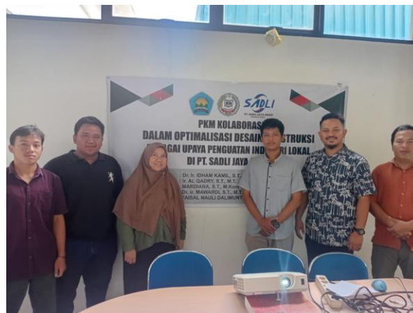
Gambar 5. Foto bersama tim pengabdian dan mitra PT. Sadli Jaya Abadi setelah pelaksanaan program pelatihan dan pendampingan desain konstruksi

desain teknis melalui penggunaan AutoCAD, pemahaman manajemen usaha, serta pemanfaatan teknologi digital dalam promosi dan pemasaran.