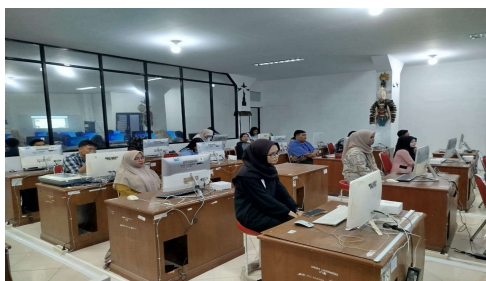
Gambar 2. Ruang Laboratorium kegiatan