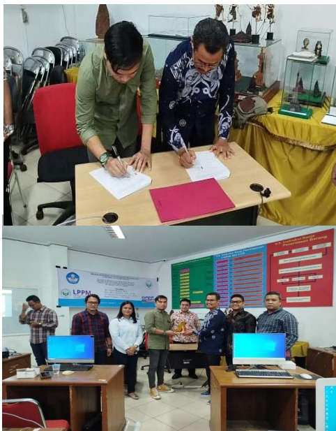
Gambar 4. Penandatanganan IA (Kerjasama) Tim PKM melalui Jurusan Pendidikan Sejarah dengan MGMP Sejarah Kota Medan