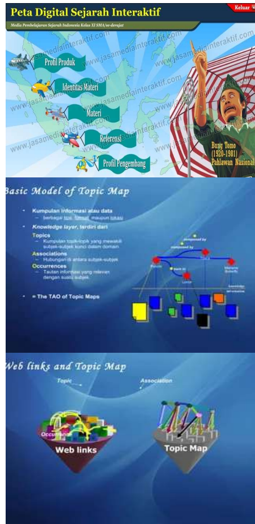
Gambar 3. Gambaran umum Aplikasi Interactive Historical Map