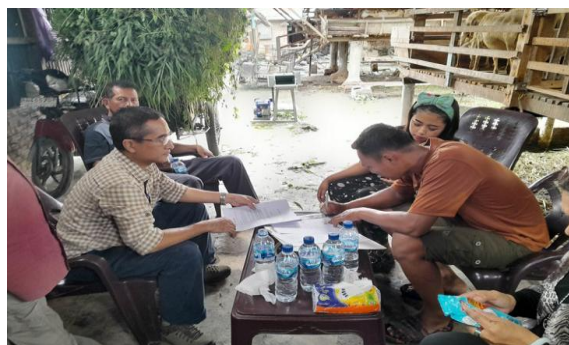
Gambar 5. Serah terima mesin