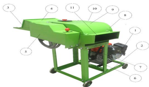
Gambar 2. Gambar mesin yang dibangun

Diagram alir pengabdian masyarakat ini ditunjukkan pada gambar 3.