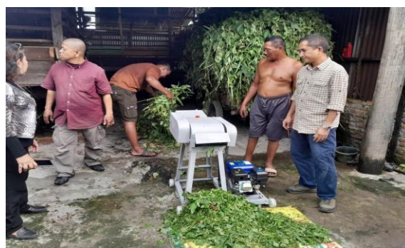
Gambar 4. Demonstrasi kinerja mesin

Dari hasil pantauan di lapangan jumlah pakan yang terbang di bawah kandang sudah jauh berkurang dengan pakan hasil cacahan dengan menggunakan mesin pencacah rumput ini, dimana pakan yang terbang tinggal 10% s.d 12% saja. Adapun dokumentasi kegiatan dapat dilihat pada gambar 4 dan 5.