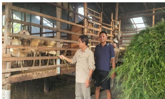
Gambar 1. Bersama mitra di depan kandang kambingnya

Hijauan makanan ternak (forages) menjadi bahan makanan yang sangat vital bagi ternak dan menjadi dasar penting dalam usaha pengembangan peternakan. Untuk meningkatkan produktivitas ternak, penting untuk memperhatikan ketersediaan pakan hijauan yang cukup baik dari segi kualitas maupun kuantitas, sehingga kebutuhan zat makanan ternak terpenuhi dengan baik dan tujuan produksi ternak dapat tercapai secara berkesinambungan. Dusun I Desa Amplas Kecamatan Percut Sei Tuan Sebagian penduduknya memelihara ternak selain mata pencaharian utama yaitu berladang. Ternak yang dipelihara umumnya kambing dari jenis domba karena pemeliharaannya lebih mudah dibandingkan kambing jenis lainnya. Meski banyak peternak kambing dijumpai di dusun ini, tetapi belum satupun yang tergabung dalam kelompok peternak.