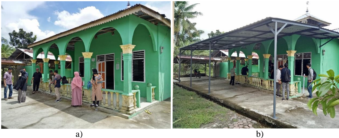
Gambar 3. a) Sebelum pelaksanaan kegiatan; b) Setelah pelaksanaan kegiatan.

Hasil yang dicapai pada pengabdian masyarakat ini adalah peningkatan kualitas layanan musala melalui pembangunan kanopi. Pembangunan kanopi ini mampu menyediakan tambahan ruang bagi warga dalam pelaksanaan kegiatan keagamaan. Komparasi sebelum dan sesudah pelaksanaan PKM dapat dilihat pada Gambar 3.