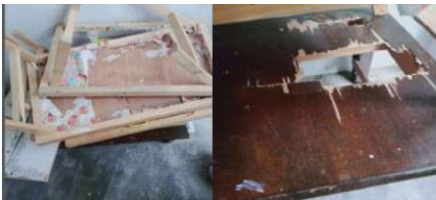
(a) (b) Gambar 3 (a) Meja Siswa (b) Meja Guru, Yang Mengalami Kerusakan