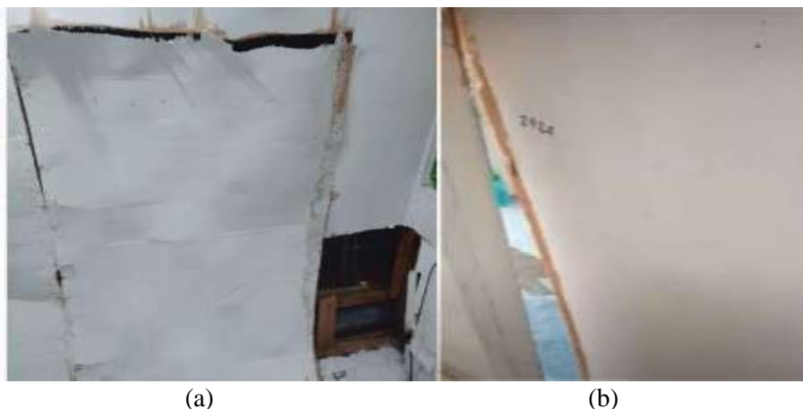
Gambar 1 (a) dan (b). Kerusakan Triplek Penyekat Dinding Antar Kelas