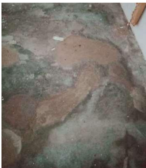
Gambar 2. Kondisi Lantai Kelas Pecah-Pecah

Adanya beberapa sarana pembelajaran yang rusak dan belum tersedia seperti rak untuk tempat Al-Quran, meja guru, dan meja murid