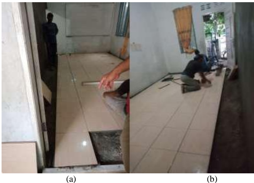
(a) (b) Gambar 5 (a) dan (b) . Proses Pemasangan Keramik Lantai

Selanjutnya adalah pemasangan keramik pada lantai ruang belajar sebagai perbaikan terhadap lantai sebelumnya yang telah rusak dan berlubang dengan ukuran 15 m 2 .