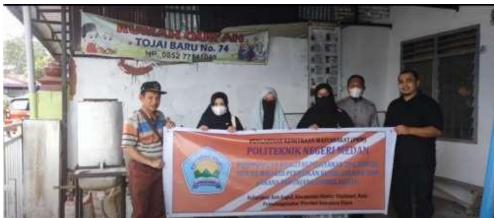
Gambar 8. Serah Terima Hasil Pekerjaan Pengabdian Kemitraan Masyarakat (PKM)