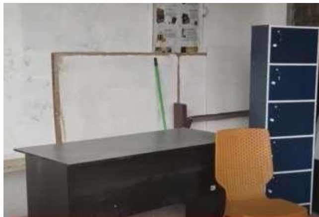
Gambar 6. Fasilitas Penunjang Proses Belajar Mengajar

Selain renovasi bangunan tersebut, pada kegiatan ini juga dilakukan pemberian fasilitas penunjang pembelajaran berupa kursi, meja dan lemari untuk tempat penyimpanan Al Quran.