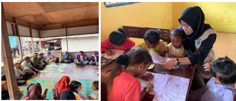
Gambar 7. Kegiatan Sosialisasi RULIFE dan Komunitas Belajar

Hasil implementasi menunjukkan bahwa keberadaan Rumah Literasi RULIFE berhasil memperluas akses belajar anak-anak di luar lingkungan sekolah melalui pembelajaran calistung, aktivitas kreatif, pendampingan belajar, serta pemanfaatan media pembelajaran berbasis internet. Pada saat yang sama, keterlibatan relawan RUMNET, pemerintah desa, dan masyarakat membentuk lingkungan belajar yang lebih inklusif dan kolaboratif sehingga anak-anak memperoleh dukungan sosial yang lebih kuat dalam proses belajarnya. Kondisi tersebut memperlihatkan bahwa keberhasilan pemberdayaan tidak hanya dipengaruhi oleh tersedianya sarana fisik, tetapi juga oleh kualitas interaksi sosial yang terbangun di dalam ekosistem pembelajaran.