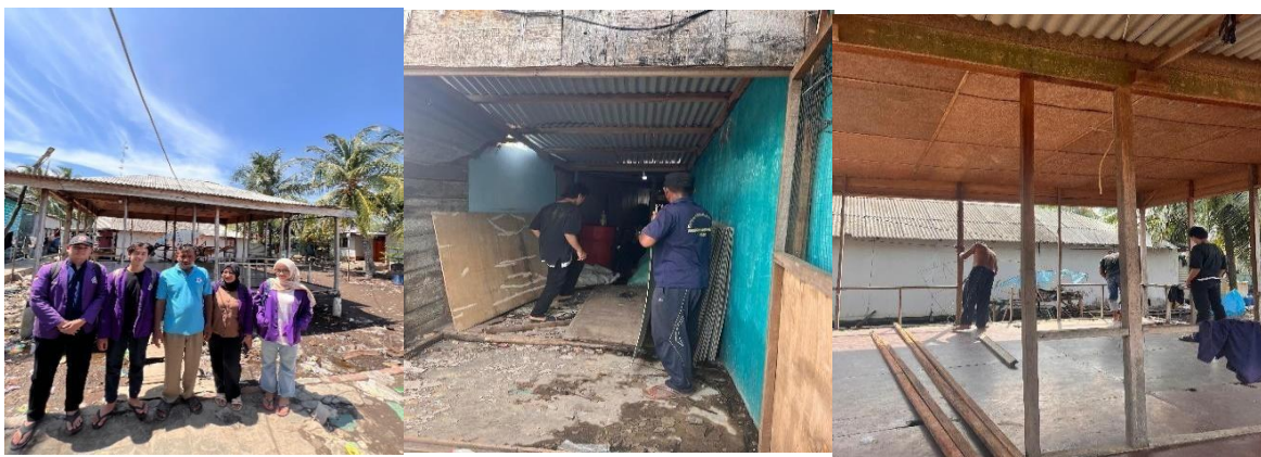
Gambar 3 Pemilihan Lokasi dan Proses Pembangunan RULIFE

Pembangunan Rumah Literasi RULIFE dilaksanakan pada 28 Juni–13 Juli 2024 melalui tahapan survei lokasi, pengadaan material, pembangunan sarana pembelajaran, hingga penyediaan fasilitas pendukung. Proses pembangunan melibatkan 4–6 orang masyarakat Desa Kwala Besar yang berpartisipasi secara aktif selama pelaksanaan kegiatan. Keterlibatan masyarakat sejak tahap implementasi menunjukkan bahwa program ini tidak bersifat top-down, tetapi dikembangkan melalui pendekatan partisipatif yang memberikan ruang bagi masyarakat untuk berkontribusi secara langsung terhadap keberhasilan program. Pendekatan tersebut memperkuat rasa memiliki ( sense of ownership ) masyarakat terhadap Rumah Literasi sehingga peluang keberlanjutan program setelah kegiatan pengabdian selesai menjadi lebih besar.