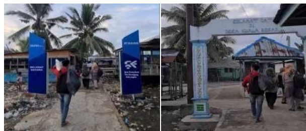
Gambar 1 Suasana Desa Kwala besar

Kondisi tersebut juga ditemukan pada masyarakat pesisir di Desa Kwala Besar, Kecamatan Secanggang, Kabupaten Langkat, Sumatera Utara. Berdasarkan hasil observasi awal dan wawancara yang dilakukan Tim PKM bersama Kepala Desa pada Februari 2024, ditemukan bahwa anak-anak di desa ini sebenarnya memiliki antusiasme yang tinggi untuk belajar, namun kesempatan mereka untuk mengembangkan kemampuan akademik maupun nonakademik masih sangat terbatas. Desa Kwala Besar merupakan salah satu desa di Kecamatan Secanggang, Kabupaten Langkat, Sumatera Utara. Desa ini memiliki jumlah penduduk 1.587 jiwa yang tersebar dalam 423 kepala keluarga , dan saat ini memiliki jumlah penduduk miskin sebanyak 88 jiwa, dengan sebagian besar masyarakat bekerja sebagai nelayan. Data pemerintah desa menunjukkan bahwa masih terdapat 30 anak putus sekolah , sementara sebagian anak usia sekolah masih mengalami kesulitan dalam kemampuan membaca, menulis, dan berhitung ( calistung ).