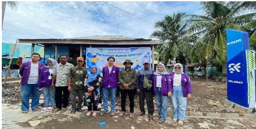
Gambar 6. Peresmian RULIFE, Tim Bersama Perangkat Desa

Sementara itu, indikator peningkatan kemampuan calistung dan penerapan life skills mencapai 90% . Capaian ini menunjukkan bahwa meskipun sebagian besar anak telah mengalami peningkatan kemampuan literasi dasar, masih terdapat sekitar 10% peserta yang belum mampu menguasai kemampuan membaca, menulis, dan berhitung secara optimal. Kondisi tersebut merupakan hal yang wajar mengingat penguasaan kompetensi dasar memerlukan proses pembelajaran yang berkesinambungan dan dipengaruhi oleh berbagai faktor, seperti latar belakang pendidikan keluarga, intensitas pendampingan di rumah, tingkat kehadiran peserta, serta kemampuan awal setiap anak yang berbeda-beda. Dengan demikian, peningkatan kemampuan literasi dasar merupakan proses jangka panjang yang memerlukan kesinambungan pembelajaran, bukan hasil yang dapat dicapai melalui intervensi dalam waktu singkat.