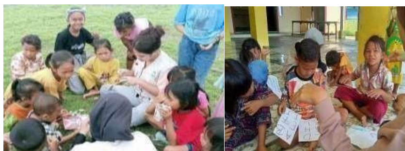
Gambar 2 Anak-anak yang Semangat dan Antusias dalam Belajar

Kemudian, jika dilihat dari pendidikan, antara kota dan desa terdapat kesenjangan, terutama dalam kualitas pembelajaran, yakni kualitas pembelajaran di desa lebih rendah daripada di kota. Hal tersebut terjadi karena jumlah tenaga pengajar yang minim, khususnya di desa terpencil. Rendahnya minat guru dan siswa dalam melaksanakan pembelajaran terjadi karena fasilitas yang kurang memadai serta tidak tersedianya akses internet, sehingga siswa hanya mengandalkan guru sebagai sumber informasi (Harahap, 2019). Dengan menghadirkan social community yang mengabdikan sebagai upaya dalam membantu anak-anak yang masih ketinggalan pembelajaran yang bersumber dari internet seperti, menampilkan video tentang materi pembelajaran, video tutorial, mengkolaborasi pembelajaran dengan kuis, dan pelatihan lainnya dalam mengembangkan minat dan bakat sehingga dapat mengembangkan talenta anak di usia dini yang menjadikan social community sebagai guru yang menjadi fasilitator dalam mendukung pembelajaran.