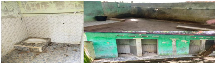
Gambar 4 Keadaan Mitra Sebelum Kegiatan

2. Cara kerja, dilakukan dengan Kerjasama tim menghadirkan, semua bagian wc yang rusak dibongkar, Bagian wc yang rusak tersebut diganti baru, dinding yang kusam dicat kembali, keramik yang pecah dibongkar dan diganti baru, Untuk memperindah tampilan tempat wudhu dipasang dinding dari batang bambu, dan peralatan plumbing yang rusak juga diganti baru seperti pipa air bersih, kran dan lainnya. Pelaksanaan dilakukan dengan gotong royong oleh tukang yang didatangkan khusus untuk membantu perbaikan kerusakan tersebut di bawah koordinasi Pimpinan Pondok Pesantren. Komparasi keadaan mitra sebelum dan sesudah kegiatan dapat dilihat pada gambar berikut: