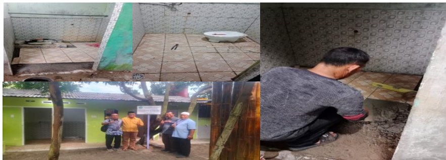
Gambar 5 Keadaan Mitra Sebelum Kegiatan