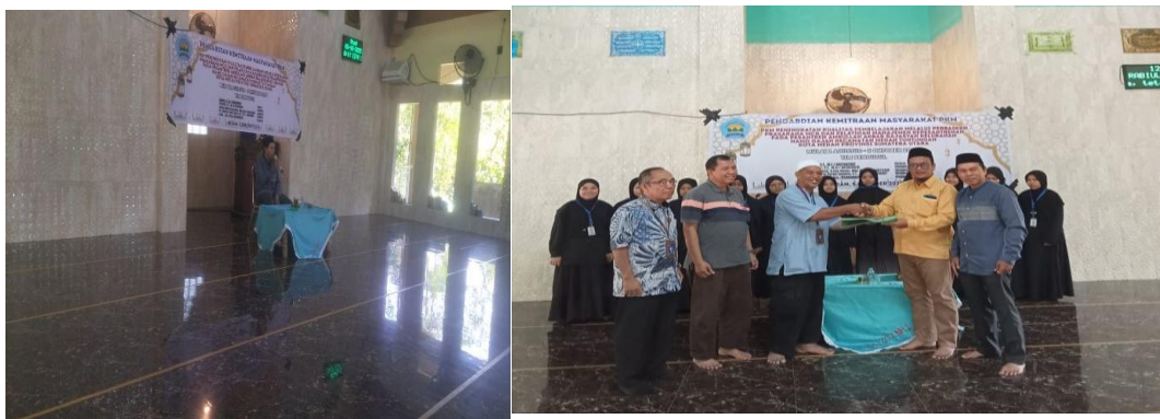
Gambar 6 Penyampaian Materi dan Serah Terima Hasil PKM Sarana Prasarana Pesantren dari Politeknik Negeri Medan Kepada Pengelola Pesantren

Setelah berdiskusi dengan Pengurus Pondok Pesantren Amarullah Akbar Rajasyah, maka perlu dilakukan pengabdian lanjutan dengan melakukan rabat beton pada jalan masuk menuju lokasi pesantren yang masih berupa tanah. Tim Pelaksana berupaya untuk dapat memaksimalkan pelaksanaan kegiatan PKM ini, maka walaupun kegiatan telah selesai dilakukan Tim tetap melakukan komunikasi dengan mitra terkait kondisi sarana prasarana setelah kegiatan PKM ini dilakukan. Harapan Tim, terlebih masyarakat, pada masa mendatang kegiatan ini dapat dilanjutkan dengan melakukan rabat beton dan perkerasan jalan pada jalan akses tersebut.