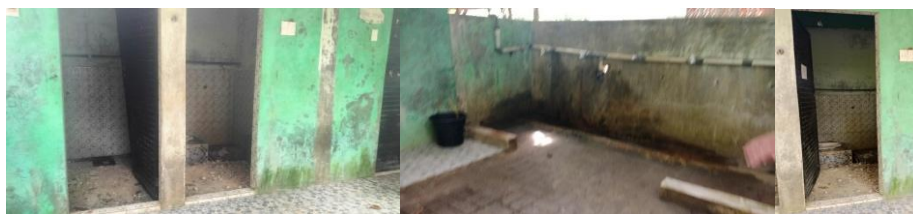
Gambar 2 Kondisi Ruang WC Pesantren yang Rusak

berpotensi menimbulkan tekanan penggunaan fasilitas, menurunkan kualitas higiene lingkungan, serta berdampak pada kenyamanan belajar. Lebih lanjut dapat dilihat pada gambar berikut: