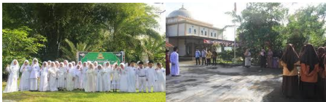
Gambar 1. Pondok Pesantren Amrullah Akbar

Lokasi tempat pondok pesantren ini berdiri cukup asri dengan banyaknya pepohonan dan burung-burung liar sehingga menambah kesan teduh dan betah bagi para siswa yang belajar didalamnya, dapat dilihat pada Gambar 1.