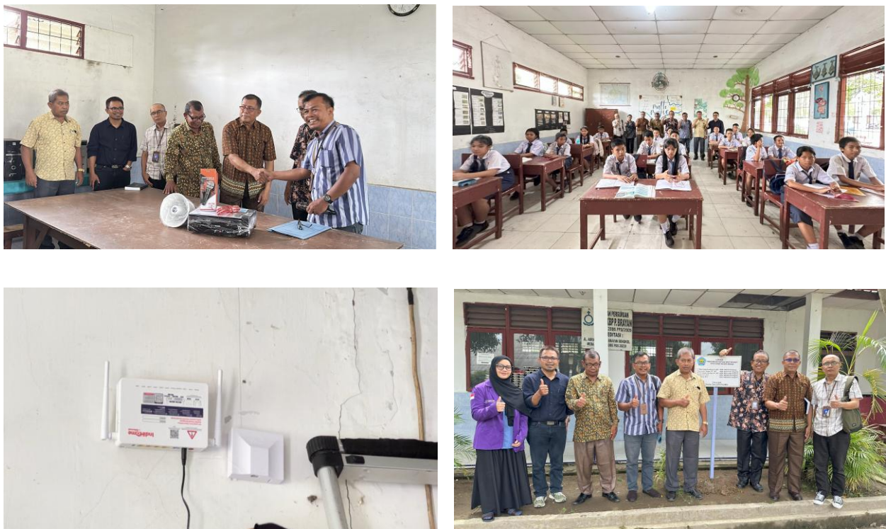
Gambar 2. Foto kegiatan

Pelaksanaan kegiatan dapat dilihat pada Gambar 2.