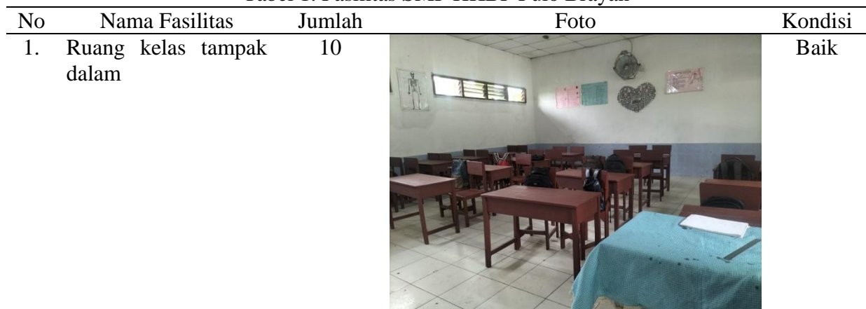
Tabel 1. Fasilitas SMP HKBP Pulo Brayan

Mitra dalam kegiatan ini SMP HKBP Pulo Brayan. Sekolah ini didirikan pada tahun 1972. Pada saat ini, SMP HKBP Pulo Brayan memiliki siswa sebanyak 120 orang dan jumlah guru yang mengajar sebanyak 10 orang. Banyak prestasi yang sudah diraih oleh siswa SMP HKBP Pulo Brayan, seperti Juara 2 lomba vocal solo tingkat regional Kota Medan pada tahun 2023, dan Juara 3 vocal grup gereja tingkat kecamatan tahun 2023. Prestasi ini masih berupa prestasi non akademik. Untuk itu, perlu ditingkatkan prestasi-prestasi siswa pada bidang akademik. Selain itu, pihak sekolah memiliki program unggulan seperti pembinaan sikap spritual melalui kegiatan kerohanian. Program ini berguna untuk meningkatkan mental dan kemampuan diri para siswa. Berdasarkan hasil survey, fasilitas yang telah dimiliki oleh pihak sekolah masih minim seperti ruang belajar siswa, meja belajar siswa, kursi belajar siswa, dan ruang perpustakaan. Foto fasilitas yang ada dapat dilihat pada Tabel 1.