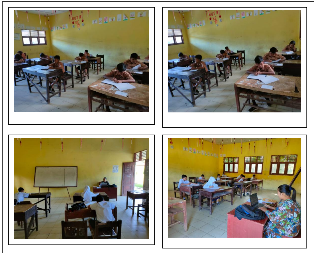
Gambar 1. Dokumentasi kondisi sarpras SMP Eka Nusantara

mengurangi efektivitas pembelajaran. Kondisi sarana prasarana saat ini di sekolah SMP Eka Nusantara seperti terlihat dalam Gambar 1.