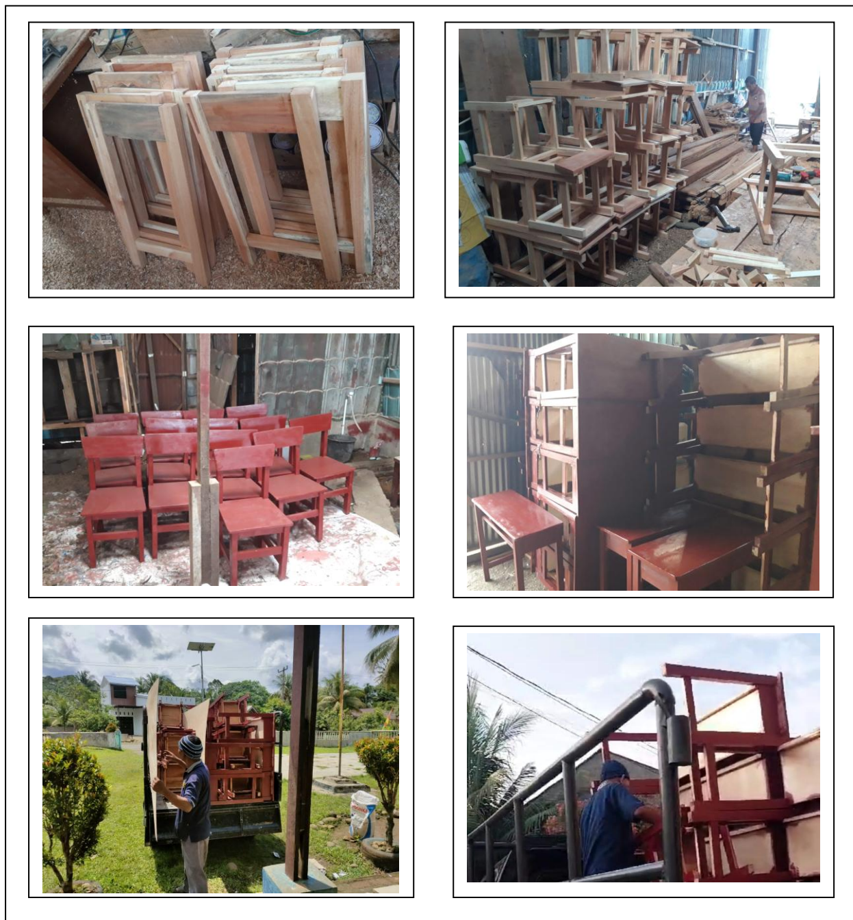
Gambar 3. Pabrikasi, finishing dan mobilisasi

Data sarana prasarana setelah pelaksanaan kegiatan dapat dilihat pada Tabel 3.