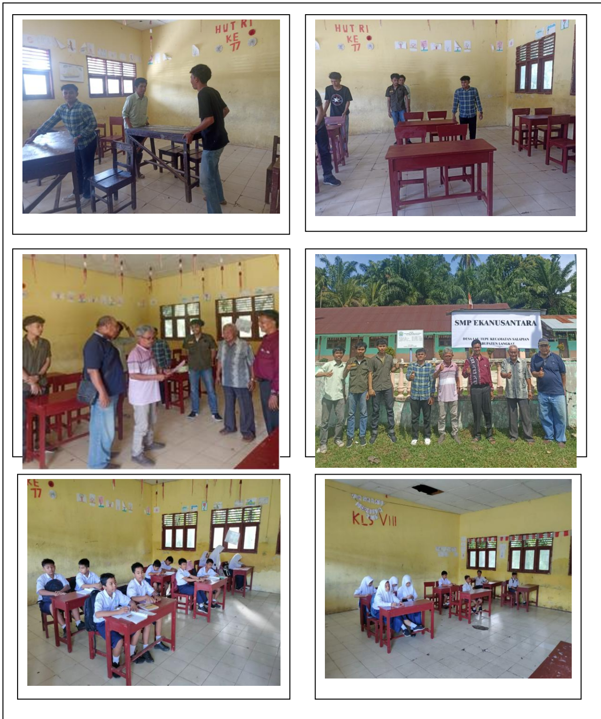
Gambar 4. Serah terima, Penyusunan meja kursi, dan Suasana belajar dengan sarpras baru

Permasalahan SMP Eka Nusantara yang sebelumnya terkendala keterbatasan sarana prasarana yaitu meja, kursi dan papan tulis ( White Board ), dapat diatasi dengan penggantian sarpras yang rusak atau tidak layak fungsi. Kondisi sebelum dan sesudah pelaksanaan dapat dilihat pada Gambar 5.