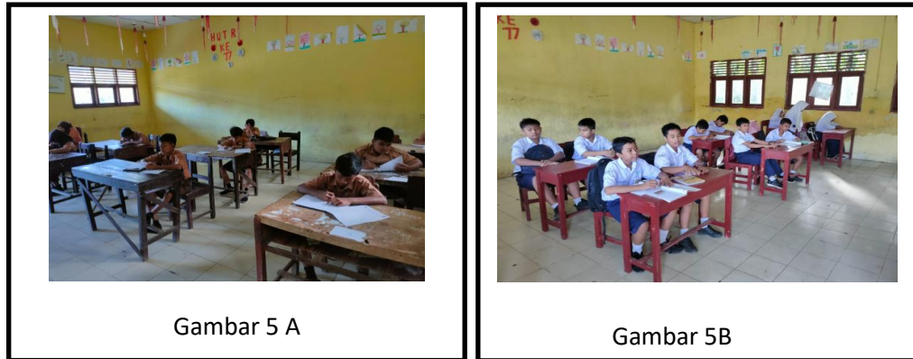
Gambar 5. Gambar 5 A Sebelum Kegiatan Gambar 5B Sesudah Kegiatan