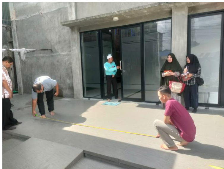
Gambar 5. Pengukuran teras masjid

Berdasarkan tabulasi permasalahan di atas, tim pengabdian bersepakat dengan mitra bahwa permasalahan mitra yang menjadi skala prioritas adalah point 1 yaitu kurang luasnya area sholat untuk hari jumat.