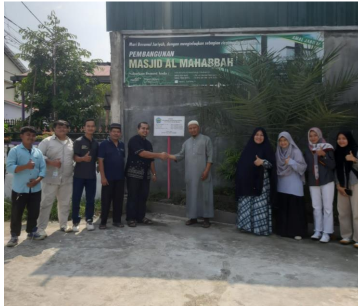
Gambar 7. Serah Terima Kanopi

Kanopi yang telah diserahterimakan selanjutnya akan dikelola sepenuhnya oleh Mitra (BKM Al Mahabbah). Setelah kegiatan ini selesai, diharapkan masyarakat dapat menggunakan dan merawat kanopi yang telah diberikan dengan baik dan kedepannya dapat dilaksanakan kembali kegiatan pengabdian untuk permasalahan yang lain pada mitra kerjasama ini.