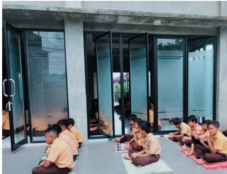
Gambar 2. Kondisi Pelaksanaan sholat Jumat

Berdasarkan hal tersebut maka tim pengabdian berencana memberikan bantuan berupa pengadaan kanopi sehingga pada saat sholat jumat ataupun pada saat jemaah membludak, kanopi tersebut dapat dipasang untuk melindungi para jemaah yang sholat di pelataran masjid.