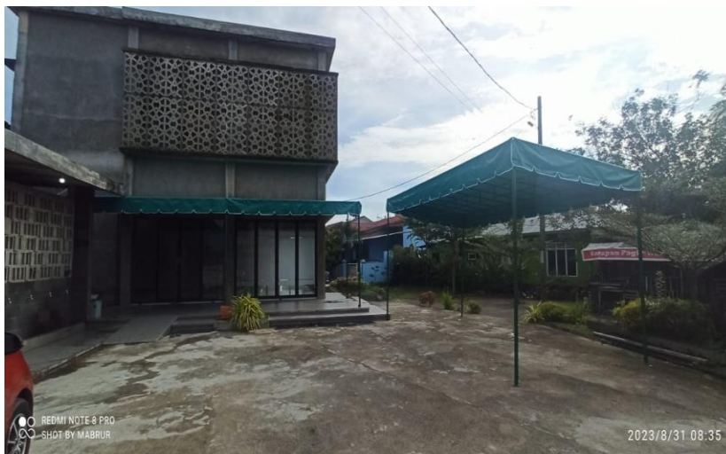
Gambar 6. Kanopi yang diserahkan terimakan

Sesuai pengukuran yang dilakukan, kanopi yang diberikan kepada mitra sebanyak 2 unit masing masing berukuran 2,8 m x 9,0 m dan 3,0 m x 6,0 m. (Gambar 6)