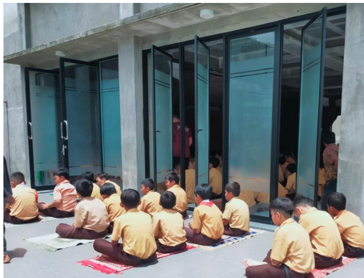
Gambar 3. Jemaah Sholat jumat di bawah terik matahari

Berdasarkan hal tersebut maka tim pengabdian berencana memberikan bantuan berupa pengadaan kanopi sehingga pada saat sholat jumat ataupun pada saat jemaah membludak, kanopi tersebut dapat dipasang untuk melindungi para jemaah yang sholat di pelataran masjid.