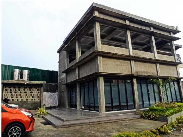
Gambar 1. Masjid Al Mahabbah

Salah satu salah satu masjid yang terdapat di Kelurahan Simpang Selayang adalah Masjid Al Mahabbah (Gambar 1). Pembangunan Masjid ini dimulai pada Maret tahun 2021 dengan dana yang berasal dari beberapa orang warga, tokoh masyarakat dan lembaga lain yang tidak mengikat. Masjid ini mulai digunakan untuk ibadah rutin pada tahun 2022. Masjid ini melaksanakan ibadah secara rutin setiap hari termasuk ibadah sholat jumat. Umumnya jemaah yang melaksanakan ibadah di masjid ini berasal dari warga yang berdomisili di sekitar masjid.