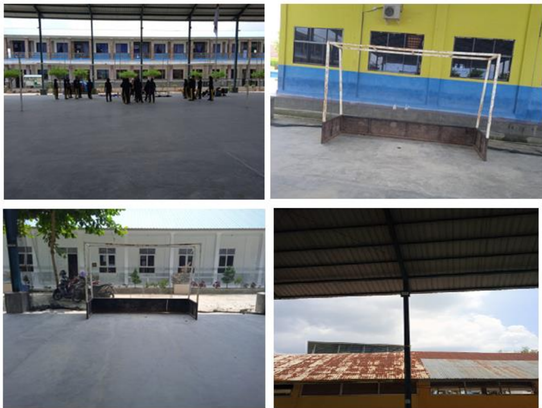
Gambar 4. Dokumentasi aset SMK T Amir Hamzah Indrapura

Selain kendala peralatan yang belum ada, tim hoki SMK T Amir Hamzah Indrapura juga memiliki tantangan yaitu pembentukan karakter dan mental pemain yang belum ditangani secara maksimal. Karakter dan mental ini sangat berpengaruh terhadap setiap pertandingan yang dilakukan. Untuk mengatasi hal ini, pihak pelatih selalu berkonsultasi dengan pihak sekolah untuk berusaha menjaga kestabilan mental dan pembentukan karakter pemain karena siswa-siswa tersebut masih berusia remaja. Kondisi remaja sangat rentan terhadap ketidakstabilan emosi, jiwa dan moral.