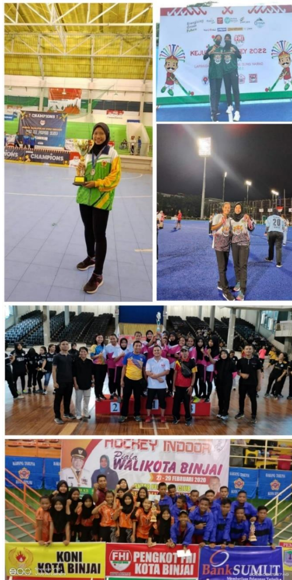
Gambar 1. Dokumentasi kegiatan Tim Hoki SMK T Amir Hamzah Indrapura