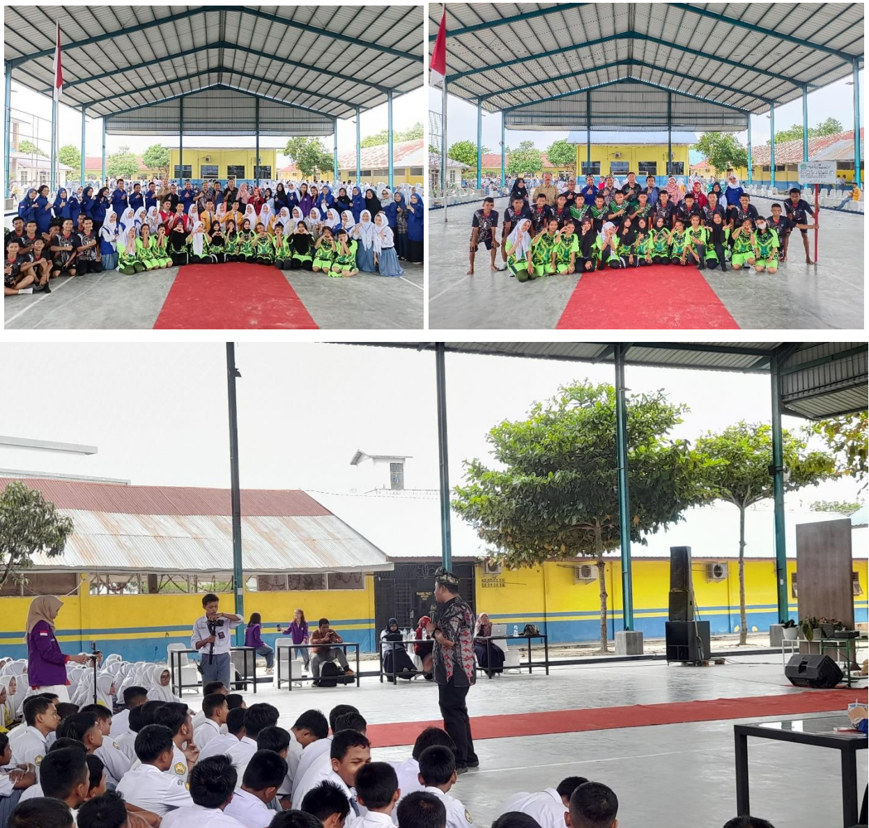
Gambar 6. Foto kegiatan

Setelah diadakannya kegiatan ini SMK T Amir Hamzah Indrapura menerima tambahan bantuan berupa papan skor digital sebagai papan informasi pertandingan, pembatas lapangan yang berfungsi sebagai pembatas dan pemantul bola pada pertandingan hoki, dan juga semakin baiknya mental pemain-pemain yang sudah menerima pelatihan motivasi tentang pembentukan karakter dan mental yang siap untuk menuju ke nasional bahkan internasional.