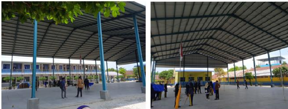
Gambar 3. Gedung olahraga (GOR) multifungsi

Berdasarkan hasil survei dan wawancara, saat ini SMK T Amir Hamzah Indrapura telah memiliki gedung olahraga (GOR) multifungsi. Gedung ini bisa digunakan untuk kegiatan olahraga hoki, bola voli, bulutangkis, futsal, tenis lapangan dan kegiatan sosial lainnya seperti upacara, dan kegiatan pesta. GOR ini yang biasa tim hoki gunakan untuk berlatih. Tim hoki ini telah berprestasi tingkat nasional dan tidak hanya mengharum nama SMK T Amir Hamzah Indrapura tetapi telah mengharumkan nama Sumatera Utara. Foto kegiatan survei dan wawancara dapat dilihat pada Gambar 2.