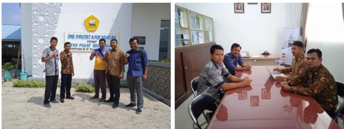
Gambar 2. Survei dan wawancara kepada calon mitra