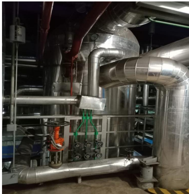
Gambar 1. High pressure heater

High pressure heater merupakan suatu alat yang berfungsi untuk memanaskan air yang akan diisi ke dalam boiler atau pemanas air umpan yang diolah pada Feed water pump . High pressure heater dibutuhkan untuk menaikkan temperatur air sebelum masuk ke boiler sehingga kerja boiler tidak terlalu berat dan apabila kinerja High pressure heater menurun akan berakibat naiknya konsumsi bahan bakar pada boiler sehingga menurunkan efisiensi PLTU dan biaya produksi meningkat. Alat ini terdiri dari sebuah shell silindris dibagian luar dan sejumlah tube ( tube bundle ) di bagian dalam, dimana temperature fluida di dalam bundle berbeda dengan di luar tube (di dalam shell ) sehingga terjadi perpindahan panas antara aliran fluida di dalam tube dan di luar tube (Pardosi, S. C. P., 2018).